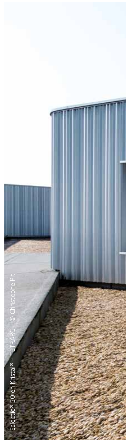
Eclectic® 50 en Cristal® - TETRARC - © Christophe Pit