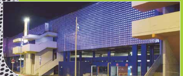
CC GRAND PLACE Grenoble (38) : Architecte : Cabinet Scau.

Par ses perforations et son emboutissage en positif et négatif Oxygen allie un haut niveau d'esthétisme à une grande facilité de pose. Sa troisième dimension obtenue grâce à un process de fabrication issu des techniques d'emboutissage de l'aéronautique, lui confère un rendu destructuré qui se joue de la lumière sur les profondeurs. La façade devient active et spectaculaire.