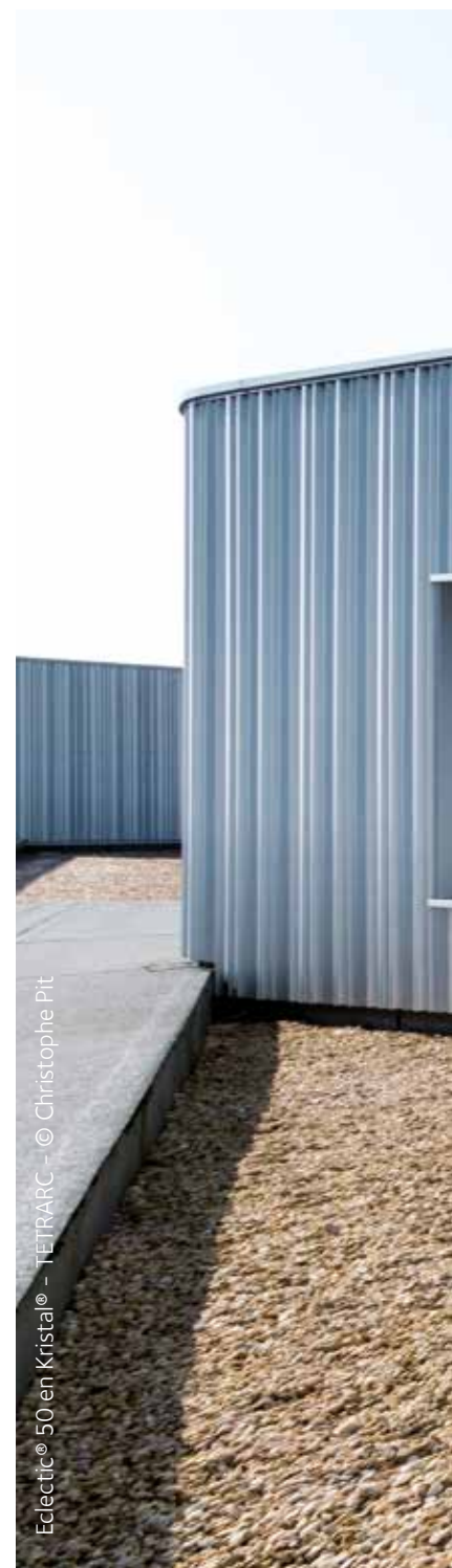
Eclectic® 50 en Cristal® - TETRARC