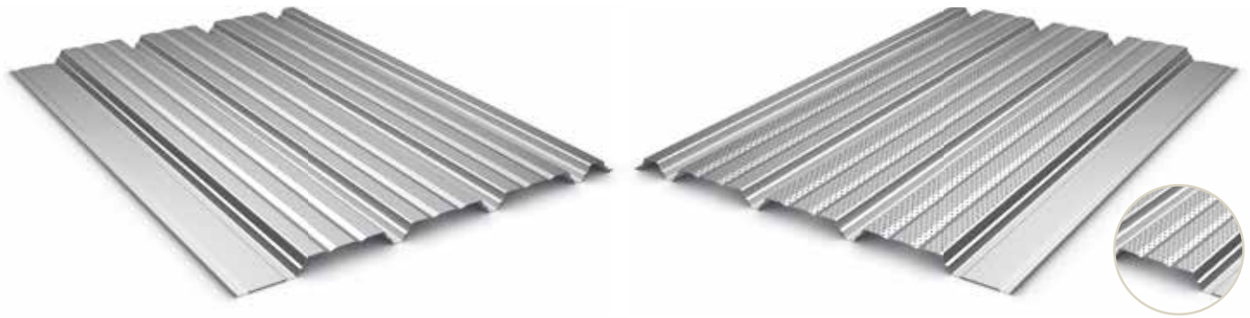
Version perforée type P - Sur plages Vide de perforation 15 % - ø 5 mm Entraxe 12,5 mm