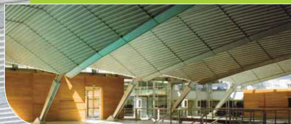
Piscine et patinoire PAILLÉRON (31) - Architecte : Mimram Marc.

Tyrex est une solution de parement en aluminium qui donne immédiatement du caractère à tous les projets. En jouant sur la fréquence des ondes et l'utilisation de la perforation standard ou sur-mesure, Tyrex vient souligner avec discrétion et subtilité - mais ce qu'il faut d'originalité - l'ensemble de la création architecturale.