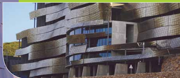
CC Perpignan (66) - Architectes : Luc Arsène Henry Jr & A.Triaud.

Par ses lignes de rupture et ses teintes aléatoires, Caïman semble avoir été poli par un vent incessant depuis la nuit des temps. Véritable fusion entre métal et nature, son effet miroitant métamorphose la matière au gré des lumières environnantes, invitant le paysage à y peindre ses couleurs au fil des heures et des saisons.