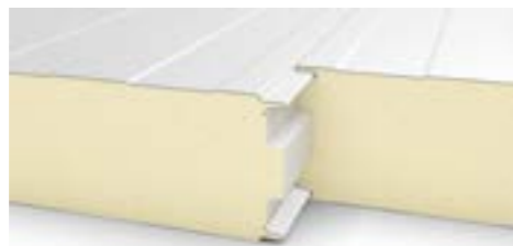
100 to 240 mm