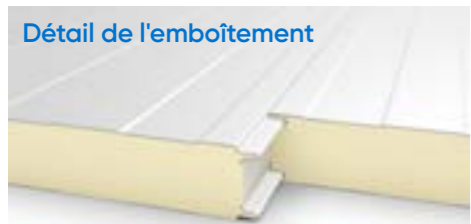
40 to 80 mm