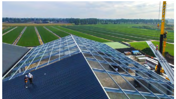
Extrem robust, umweltfreundlich und in Längen bis 18 m produzierbar: Verlegung unseres ONDAGRIP® Dachpaneels bei einem Stallneubau