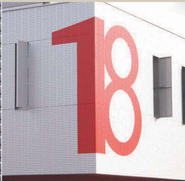
SDIS de Pau - Agence ACTA Pau et Ateliers - Architectes : Mazières