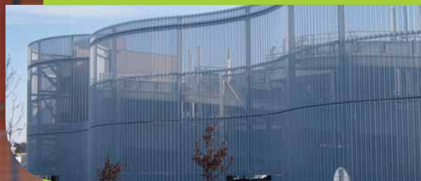
FACULTÉ DE LETTRES Reims (51) - Architecte : AAT Architecture. PARKING DES ARGOULETS (31) - Architecte : Agence Azéma.

Mascaret est un parement ajouré aux formes ondulées, avec perforations réalisables "à façon". Il donne le pouvoir de maîtriser la lumière, de la filtrer, de créer une dynamique visuelle et une transparence qui illuminent ou tamisent l'espace en fonction de l'intensité solaire, à toutes les heures du jour et tout au long de l'année.