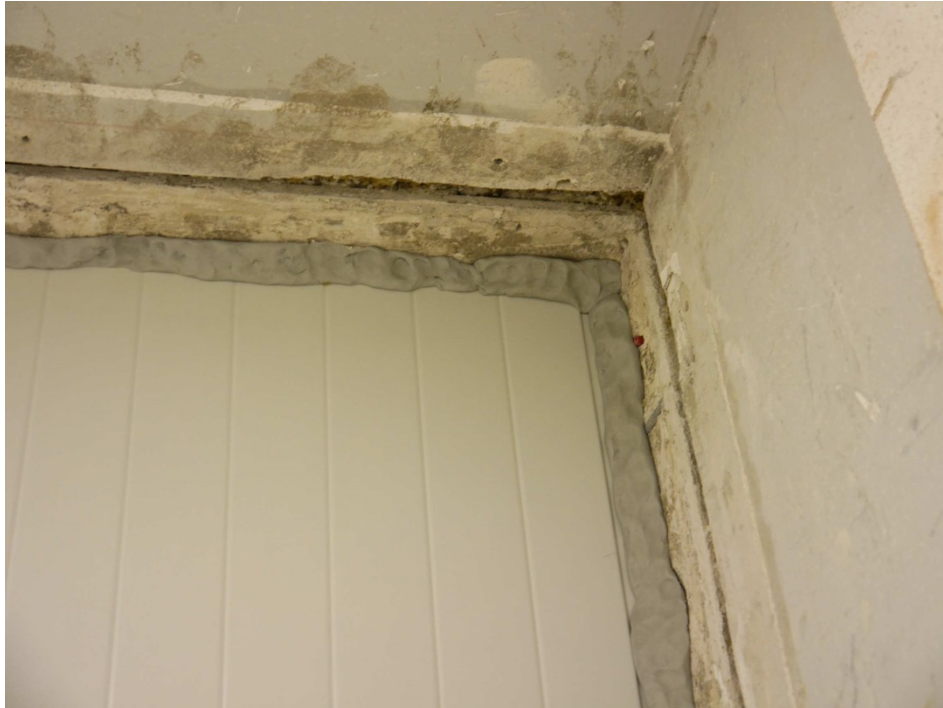
Abbildung 3. Abdichtung der Anschlussfugen zwischen Prüfobjekt und Prüfstand mit dauerplastischer Dichtmasse, empfangsraumseitig (exemplarische Abbildung).