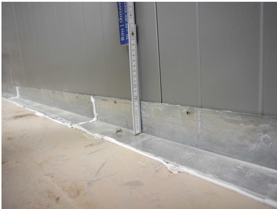
Abbildung 4. Anschluss des Prüfobjektes an den Prüfstand mit Stahlwinkeln, sende- raumseitig (exemplarische Abbildung).