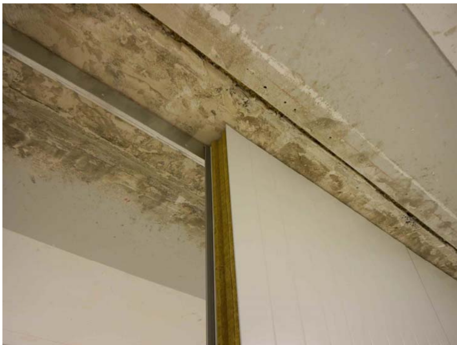
Abbildung 2. Montage der Mineralwollpaneelle in den Wandprüfstand (exemplarische Abbildung).