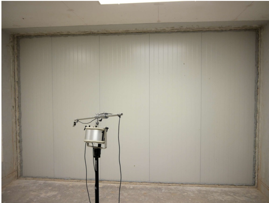
Abbildung 1. Mineralwollpaneelle Typ PFLAUM FE-010/010 100 0,75/0,75 während der Prüfung im Wandprüfstand.