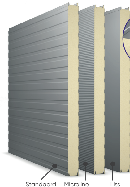
Standaard Microline Liss

Ook beschikbaar in 1000mm in isolatiedikte 40mm en 60mm.