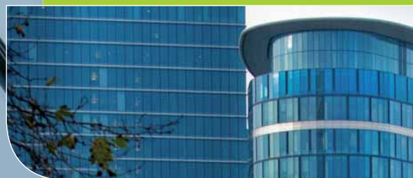
COVENT GARDEN Bruxelles - Architecte : Art Build

Belg'Onde allie la simplicité à l'esthétique, donnant à voir l'essentiel du projet créatif dans sa plus élégante expression. La possibilité d'écartement des ondes "sur-mesure" confère une grande liberté dans la conception du projet en intérieur ou en extérieur, avec une grande cohérence et unité de forme.